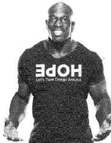
WWE Superstar Titus O'Neil

For holiday information call: Para más información llama: